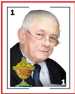
Por Enrique Avilán Periodista Taurino

*Esta corrida del domingo en Madrid , fue más que diversión, una serie de "huy...aya yaes y caras tapadas" ante el poco juego y la peligrosidad que mostraron los ejemplares de los Hijos de Celestino Cuadri y a los que lo tres matadores "plantaron cara" con valor y deseos de agradar a las diez y ocho mil personas que acudieron al inicio de la última semana del periplo de la Feria de San Isidro que concluirá el próximo domingo con la corrida de Miura , quedando pendientes las corridas de la Beneficencia y de la Cultura en la siguiente semana.