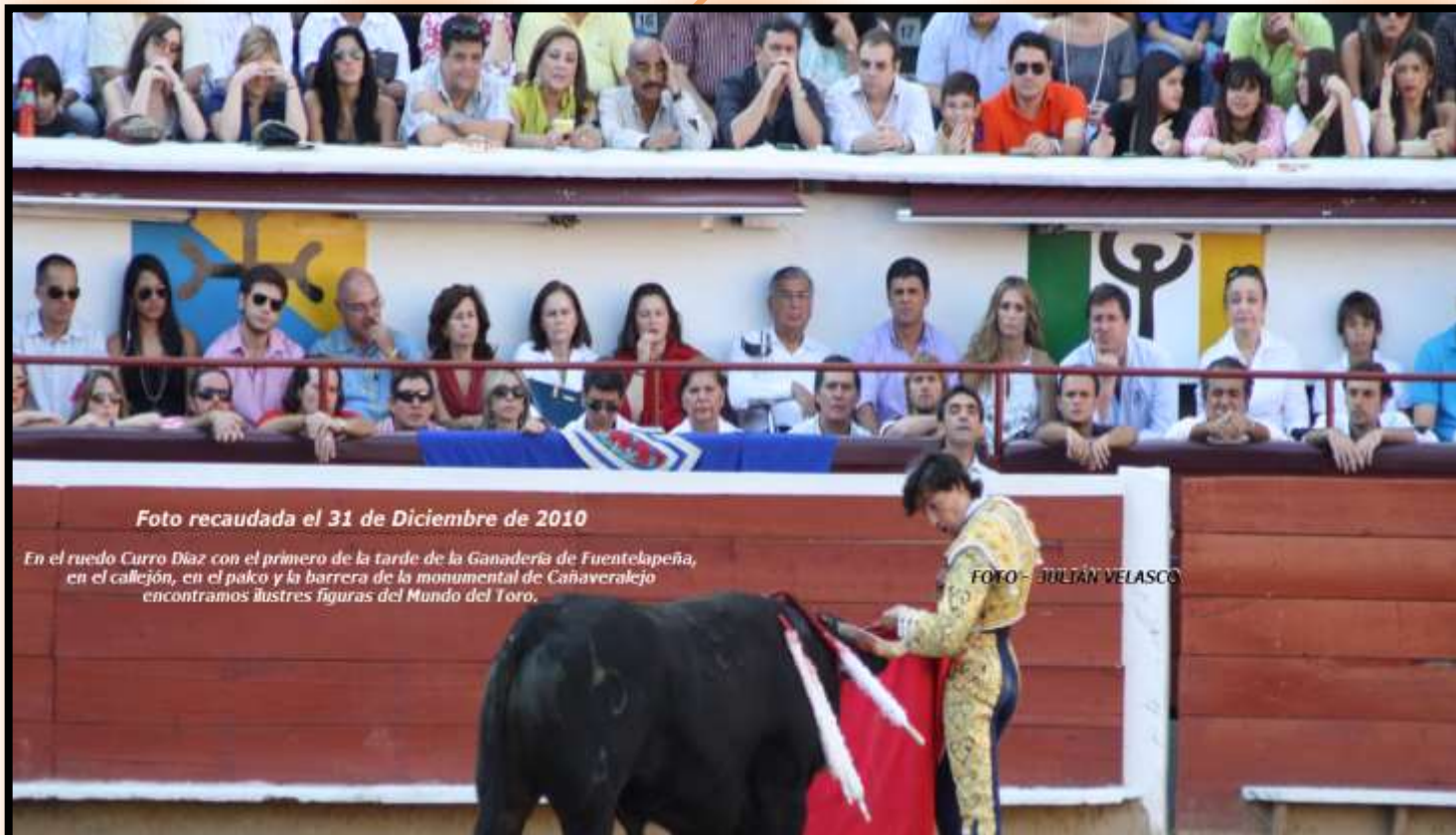
Foto recaudada el 31 de Diciembre de 2010